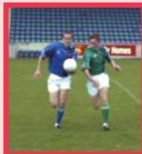
Se déplacer aux côtés de l'adversaire, les yeux sur le ballon.

Le tacle, ou near hand tackle (littéralement « tacle avec la main la plus proche ») est la technique utilisée au football gaélique pour récupérer le ballon de l'adversaire avec la main ouverte.